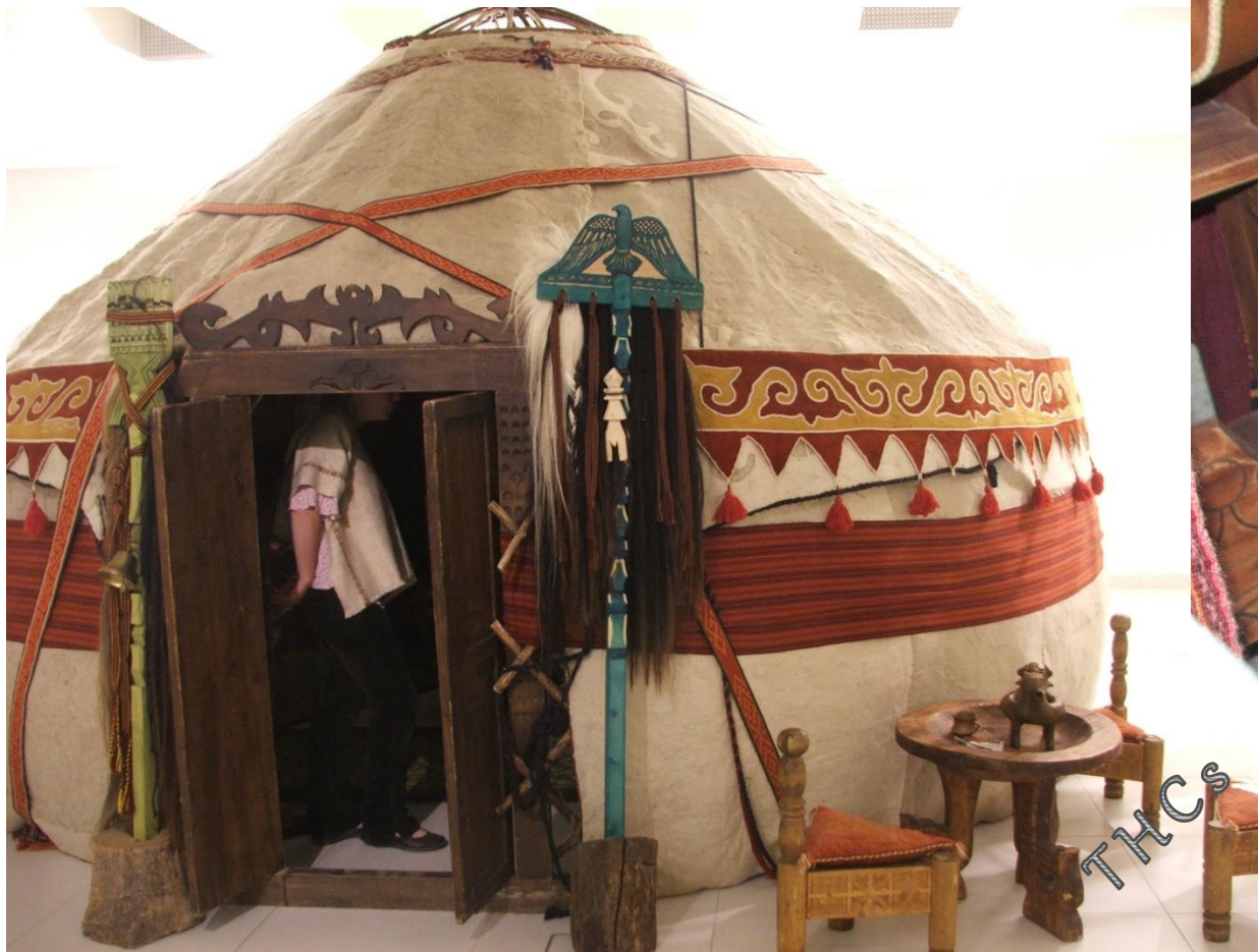
Jurta 2015. kiállítás az MMA-ban